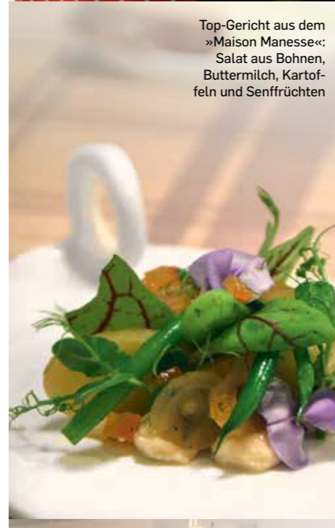
Top-Gericht aus dem »Maison Manesse«: Salat aus Bohnen, Buttermilch, Kartof- feln und Senfrüchten