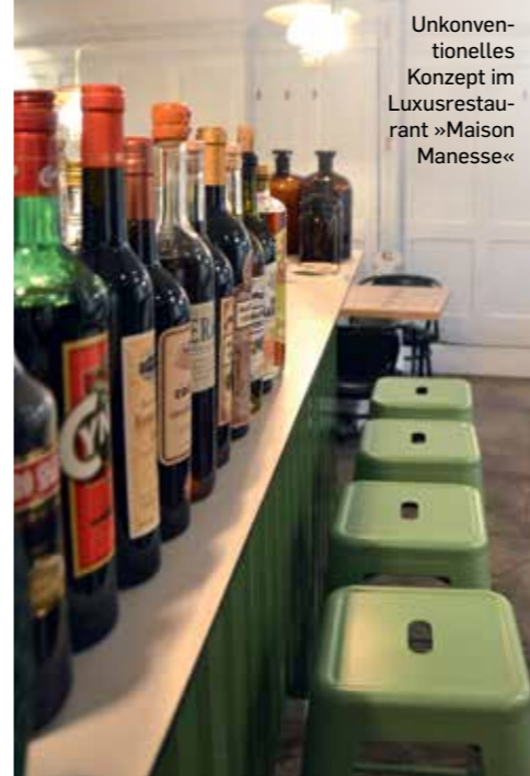
Unkon- ventionelles Konzept im Luxusresta- urant »Maison Manesse«