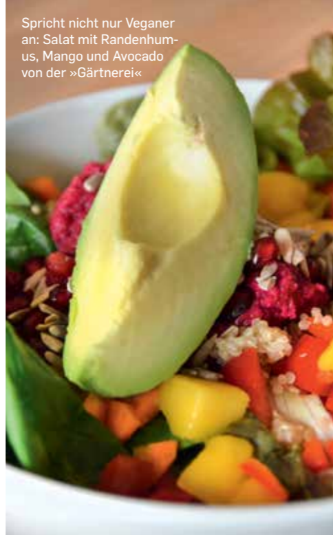
Spricht nicht nur Veganer an: Salat mit Randenhumus, Mango und Avocado von der »Gärtnerei«