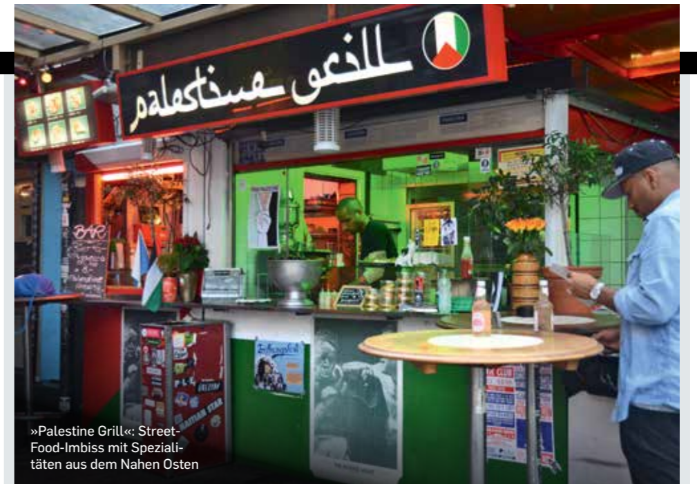
»Palestine Grill«: Street- Food-Imbiss mit Speziali- täten aus dem Nahen Osten

Sabich oder Shish Taouk – die traditionellen levantinischen Speisen, auf hohem Niveau frisch zubereitet – kommen gerade bei einem jungen Publikum gut an. Sein «Friedensteller» ist der Renner an seiner bis Mitternacht geöffneten Theke und im Übrigen eine gesunde und köstliche Alternative zu Pommes, Hotdog und Co. Dass sich auch kleine Läden ohne die Rückendeckung einer Kette erfolgreich auf dem Markt etablieren, zeugt von dem sich wandelnden Anspruch der Konsumenten. Darauf setzt auch ein Big Player wie die Warenhauskette Globus. Diese eröffnete im Oktober mit ihrer Lebensmittelabteilung Delicatessa auf 1700 Quadratmetern ein wahres Schlaraffenland für anspruchsvolle Gourmets – mit einer Palette von regionalen wie international produzierten Spitzenprodukten von Käse und Kaviar bis hin zu einem Traiteurbereich, der ein wahres Paradies für Feinschmecker darstellt.