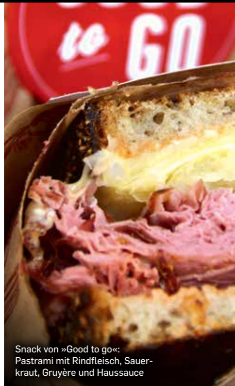
Snack von »Good to go«: Pastrami mit Rindfleisch, Sauer- kraut, Gruyère und Haussauce