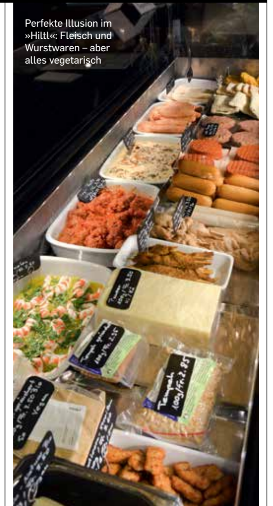
Perfekte Illusion im »Hiltl«: Fleisch und Wurstwaren – aber alles vegetarisch

> Zürich goes Streetfood! Mobile Restaurants erobern die urbane Landschaft. Food-Trucks setzen überraschende Zeichen im Stadtbild. Und neue Gastrokonzeppte verändern das gewohnte Bild der Ausgehgesellschaft. Ein Trend, der schon vor Jahren in New York und London auffiel, ist endlich auch an der Limmat angekommen. Pop-up-Restaurants eröffnen mal hier, mal dort. Steife Tischsitten haben ausgedient, und »Healthy food« setzt sich endlich auch bei den Schnellimbissen durch.