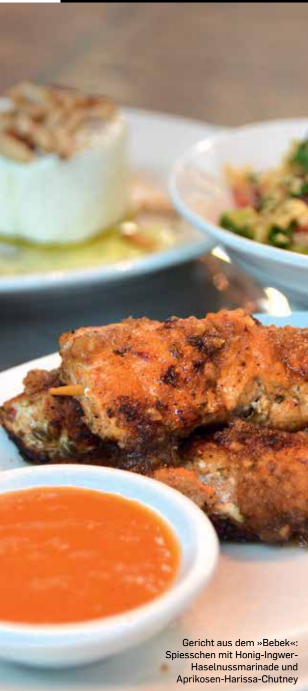
Gericht aus dem »Bebek«: Spießchen mit Honig-Ingwer- Haselnussmarinade und Aprikosen-Harissa-Chutney