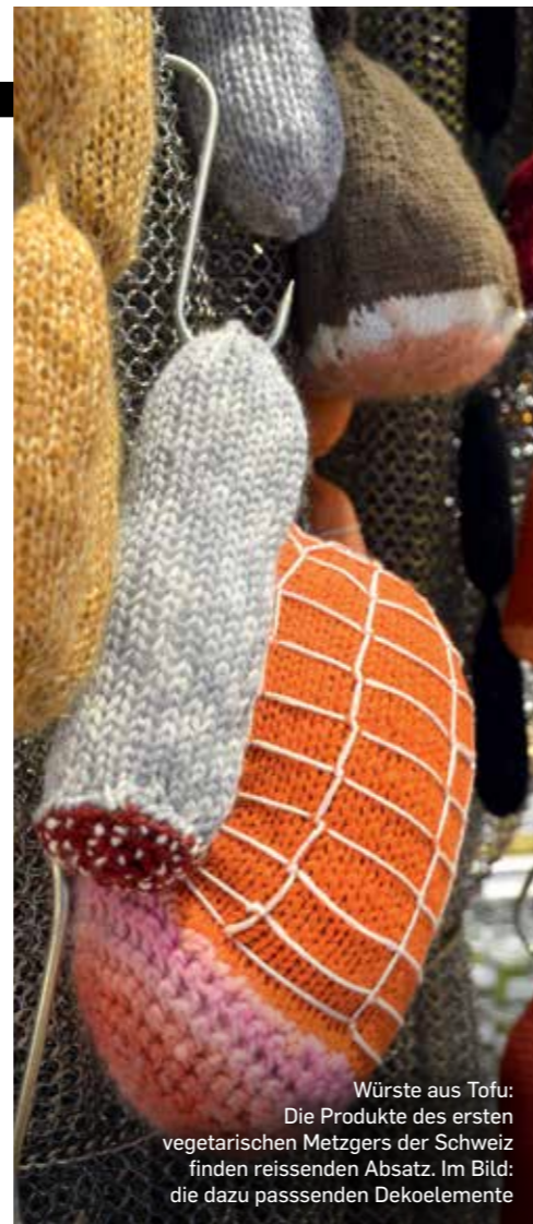
Würste aus Tofu: Die Produkte des ersten vegetarischen Metzgers der Schweiz finden reissenden Absatz. Im Bild: die dazu passenden Dekoelemente