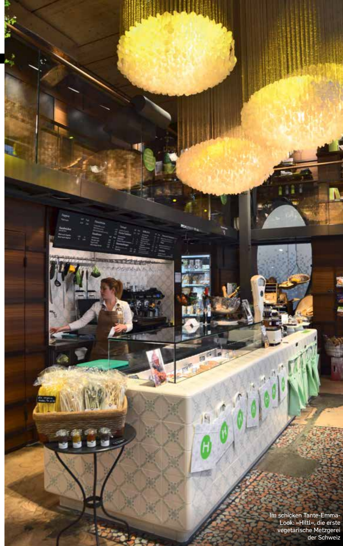
Im schicken Tante-Emma-Look: »Hiltl«, die erste vegetarische Metzgerei der Schweiz