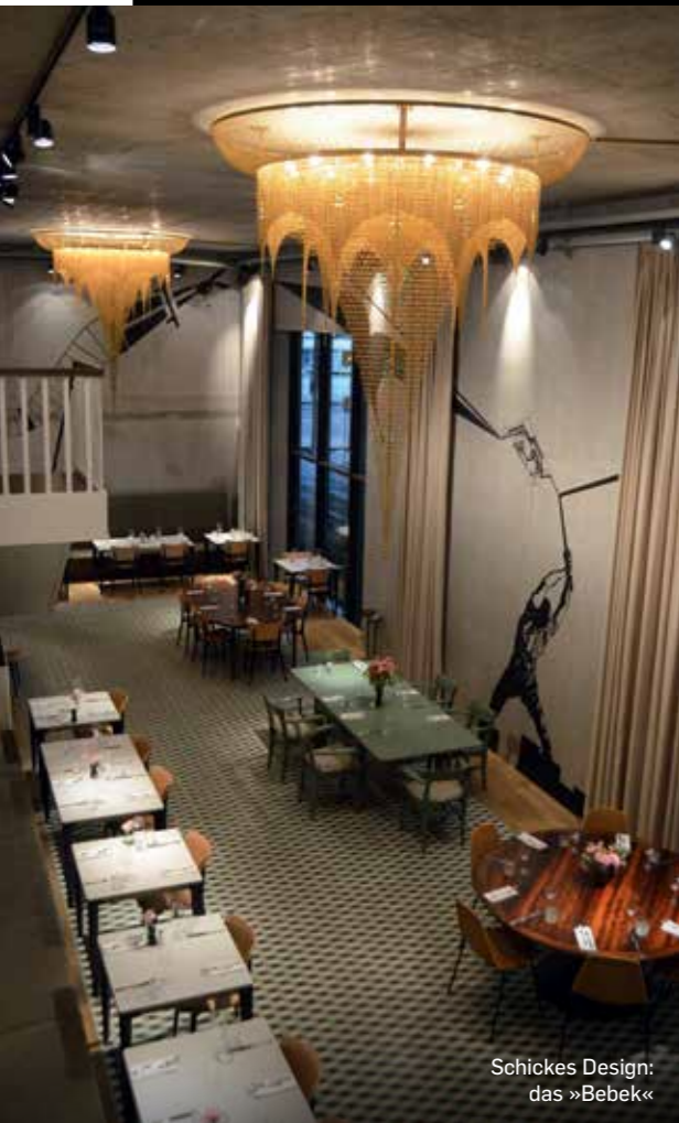
Schickes Design: das »Bebek«